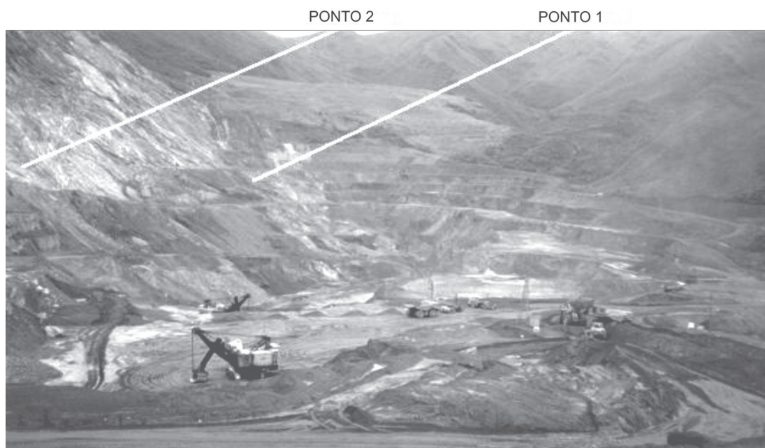
FOTO 1. Panorama geral das operações da mina de Timbopeba.

O talude tem inclinação média de 55 graus, altura atual é de cerca de 380 m, mas poderá alcançar 500 m com o prosseguimento das operações. A superfície do talude encontra-se alterada e fraturada, inclusive alguns bancos estão ausentes. Há fragmentos apenas dispostos em função do atrito, mas sem coesão. Não obstante, as operações mineiras prosseguem. Pode-se observar o talude final e a localização dos pontos de monitoramento. Estes pontos encontram-se o mais próximo possível das zonas mais fraturadas do talude, respeitando os limites mínimos de segurança para os equipamentos e pesquisadores.